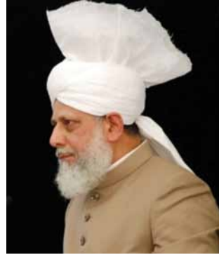
Hazrat Mirza Masroor Ahmad

Fit-22 t'April 2003, fil-Moskea ta' Fażal f'Londra, Mirza Masroor Ahmad inħatar bħala l-Hames Kalif tal-Komunità Aħmadija Musulmana li hi mxerrda mad-dinja kollha.